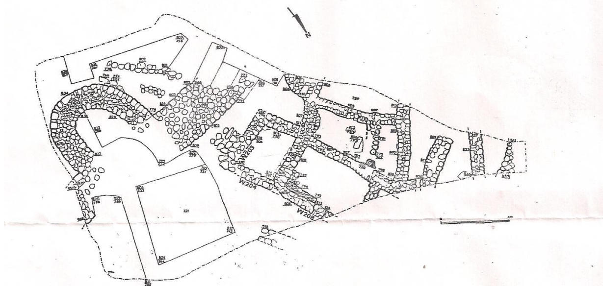
7. מעונה - תוכנית שטח החפירה.

נחשף קו ביצור, שכיוונו מזרח-מערב, הכולל מגדל חצי עגול הנסמך אל חומה שעוביה 2.8 מ' (איורים 8,7).