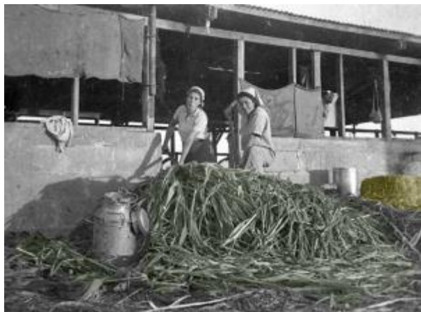
גם הענף הזה הצליח מאוד! ענף רפת.

בהמשך, הייתה גם רפת. כמובן גם הבנות השתתפו באופן שווה בעבודות.