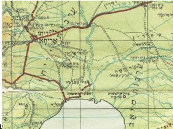
בית הערבה- צפון ים המלח