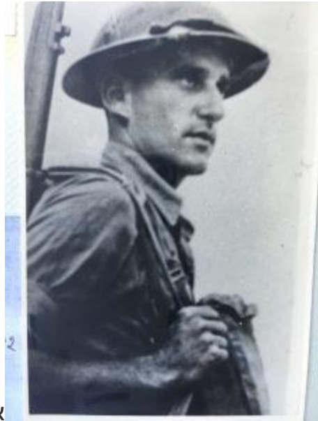
אני בצבא הבריטי

בהמשך נחסמה הדרך ביריחו ונותר רק הקשר האווירי עמו. התגייסתי לצבא הבריטי. באותה תקופה התחוללה בעולם מלחמת העולם השנייה. צבאות הצורר הגרמני התקדמו אל עבר ארץ ישראל במטרה לכבוש אותה. צבא בריטניה (אנגליה) שלחם נגד הצבא הנאצי החליט לגייס חיילים נוספים מארץ ישראל. אני החלטתי שברצוני להתנדב לצבא הבריטי בכדי לעזור בהגנה על המולדת שלי. שוב הייתי צריך לשכנע את סבתא יפה, אישתי, שכמובן בכתה ובכתה כדי שלא אלך לצבא, אבל אני התעקשתי והתגייסתי לצבא הבריטי, לחיל הנהגים. נשלחנו להילחם במדבר המערבי שנמצא בין לוב למיצריים.