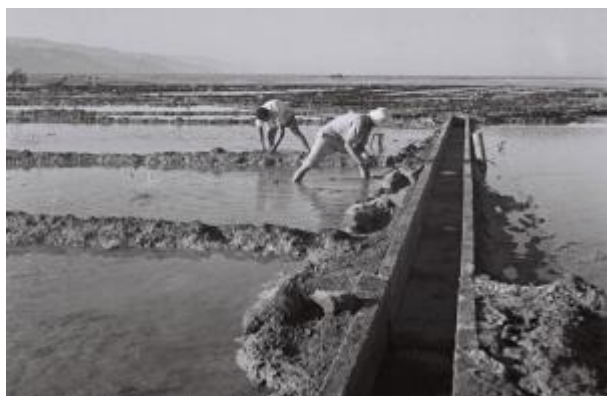
השטחים המוצפים במי הירדן המתוקים