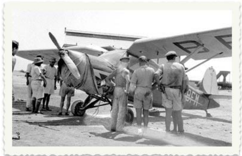
במאי 1948 נחסמה הדרך לירושלים והמפעל שותק. הקשר היחידי אליו נשמר באמצעות מטוסים קלים. ב-14 למאי מבחינים חברי בית הערבה בשיירות גדולות של שריון, תותחים ורכבי צבא שנעים מכיוון גשר אלנבי לעבר ירושלים. החשש לגורל הקיבוץ והמפעל גובר, ונובומייסקי מנסה להשיג אצל עבדאללה מלך ירדן הסכמה לניטרליות האזור.